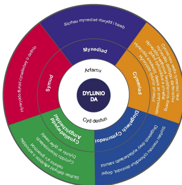
Ffigur 1: Amcanion Dylunio Da