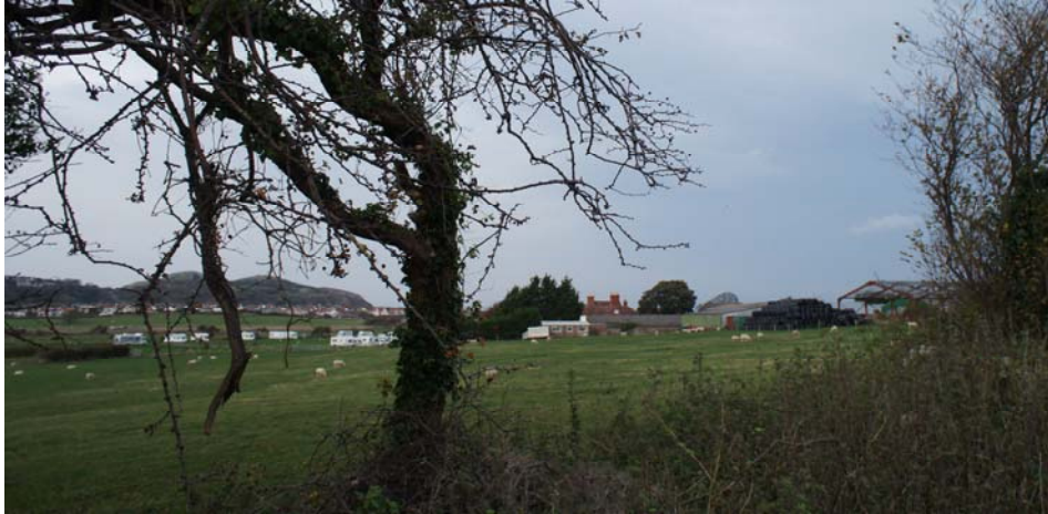
Llun 1: Yr olygfa o'r Brookfield Drive yn edrych tua'r gogledd tuag at Fferm Dinarth Hall.