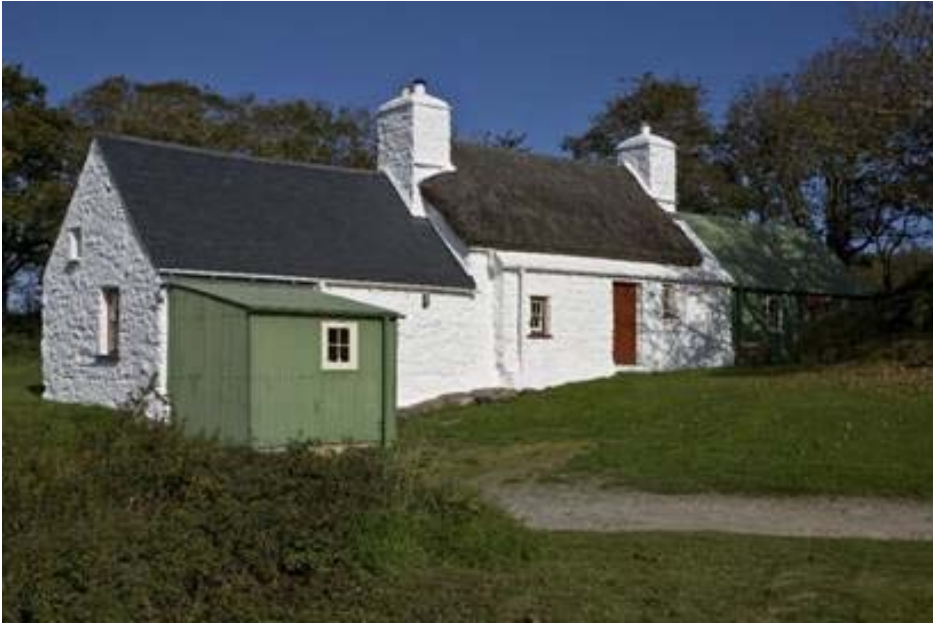
Ffigur 3 - Yr Hen Siop, Tretio.