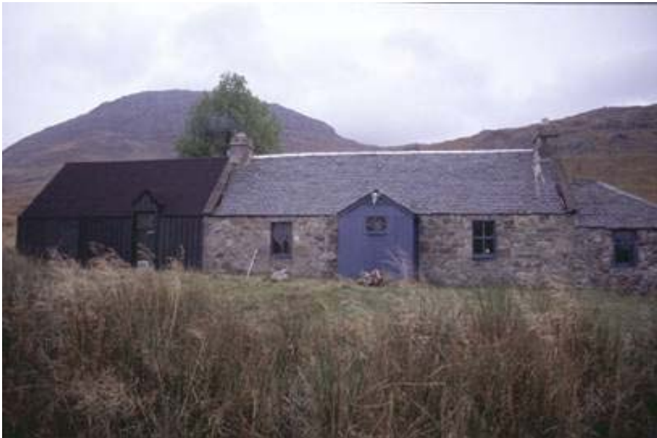
Ffigur 4 – Bwthyn Ben Alder yn yr Ucheldiroedd – Esiampl o estyniad a oedd â chladin tun du rhychiog.