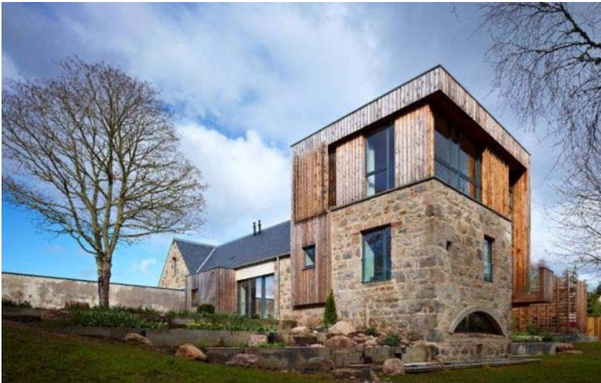
Ffigur 8 – Prosiect Melin Bogbain yn Dingwall http://www.ruraldesign.co.uk/#Bogbain-Mill http://www.scotland.gov.uk/Topics/Built-Environment/AandP/InspirationalDesigns/ProjectType/Conversionrural/BogbainMill