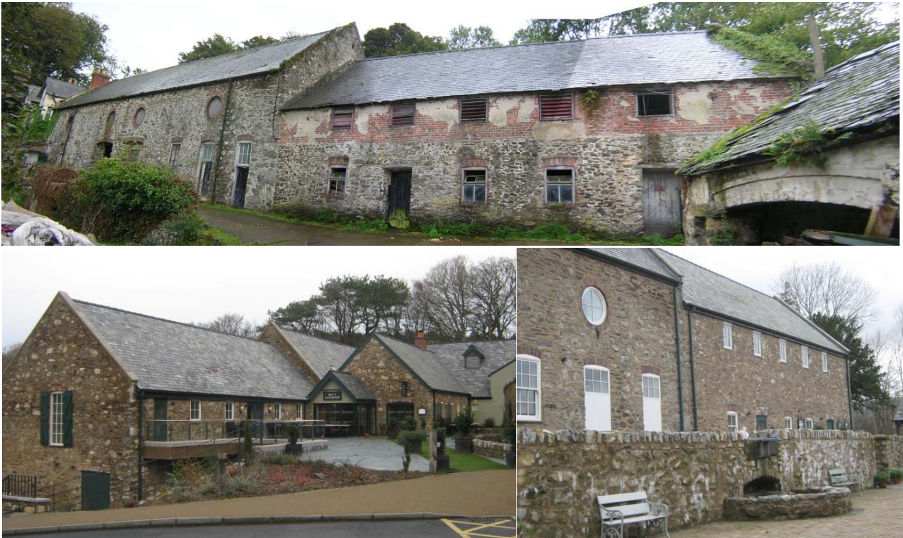
Ffigur 1 - Canolfan Fwyd Bodnant (canmoliaeth uchel yng Ngwobr Cynllunio Cymru Sefydliad Cynllunio Trefol Brenhinol 2103). Adnewyddu adeiladau canolfan arddio gyda gweithgareddau atodol cysylltiedig. Cafodd yr adeiladau presennol eu trwsio'n llawn â chafwyd gwared ar rendr presennol (mewn cyflwr gwael), i ail-amlygu wal gerrig wreiddiol. Cafodd y to presennol ei dynnu a'i godi, i ganiatáu ar gyfer ehangu at y mesanîn presennol a'r lloriau uchaf. Mae'r cynllun yn gwella'r gyfres o strwythurau ad hoc ac fe'i cefnogwyd er mwyn diogelu cyfleoedd cyflogaeth presennol.