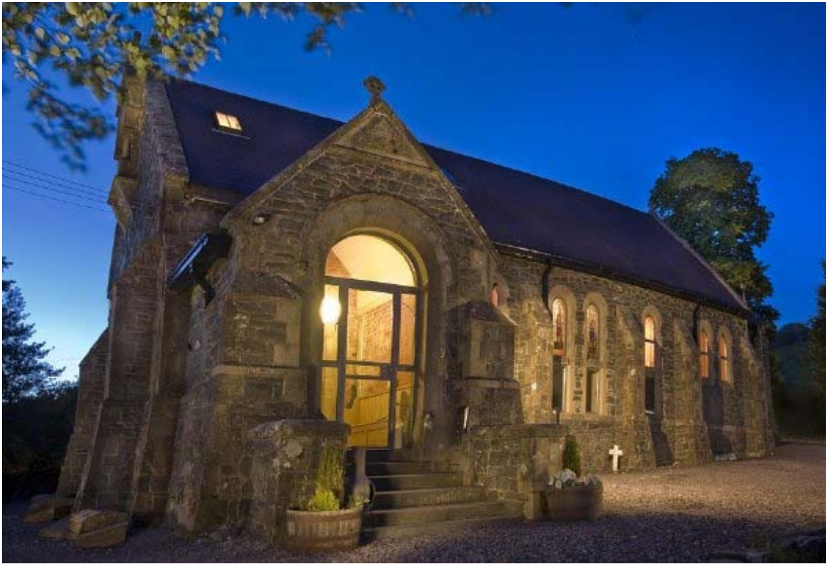
Ffigur 7 – Eglwys Sant Curig http://www.stcurigschurch.com/