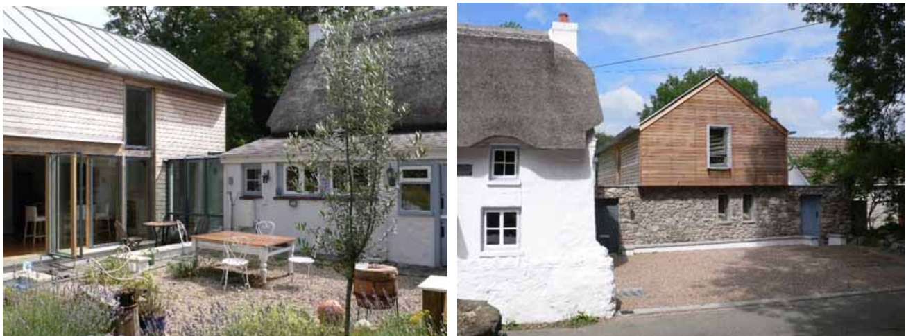
Ffigur 2 – The Nook, Oxwich (rhagor o wybodaeth ar wefan Comisiwn Dylunio Cymru http://dcfw.org/the-nook-oxwich )