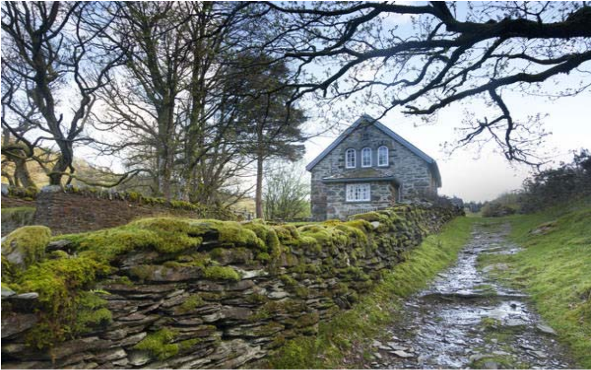
Figur 5 – Tŷ Capel, Rhiwddolion, Betws y Coed (Ymddiriedolaeth Tirnod) http://www.landmarktrust.org.uk/our-landmarks/properties/ty-capel-12658