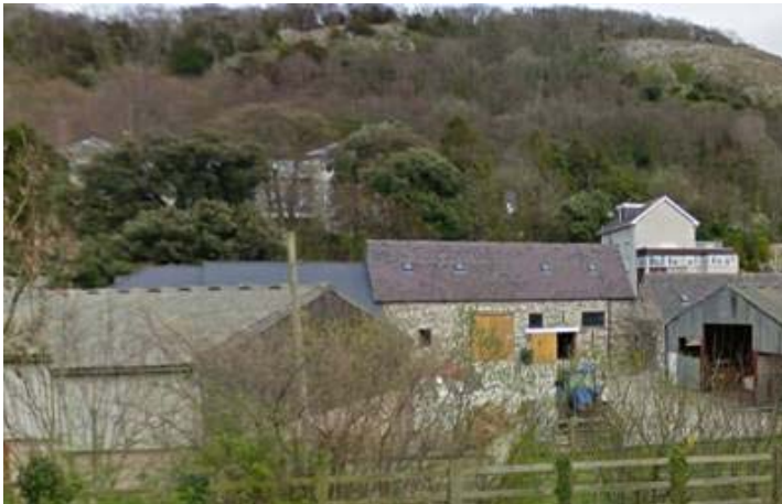
Figur 6 – Ffarm Marl, Marl Lane, Cyffordd Llandudno. Addasu tai allanol yn bedair annedd.